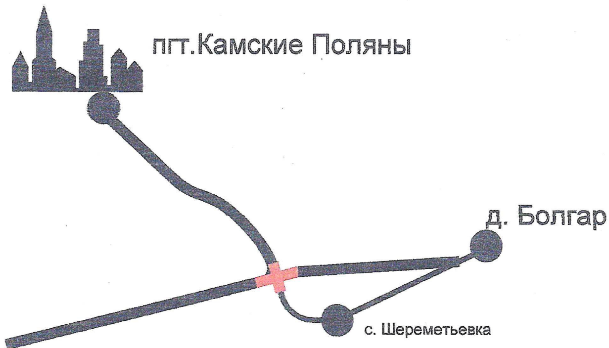
Схема маршрута с указанием линейных и дорожных сооружений и опасных участков